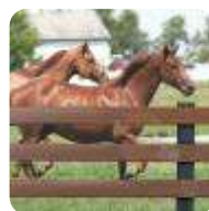
CERCAS E MOURÕES