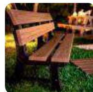
BANCOS DE JARDIM