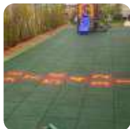
PISOS PARA PLAYGROUND