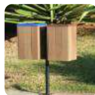
LIXEIRAS E COLETORES