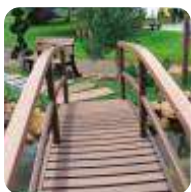
PIERS E PASSARELAS