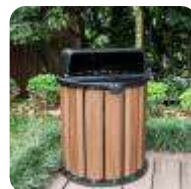
LIXEIRAS E COLETORES