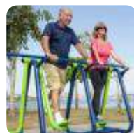
ACADEMIA AO AR LIVRE