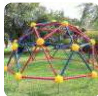
BRINQUEDOS DE AÇO