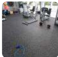
PISOS PARA ACADEMIA